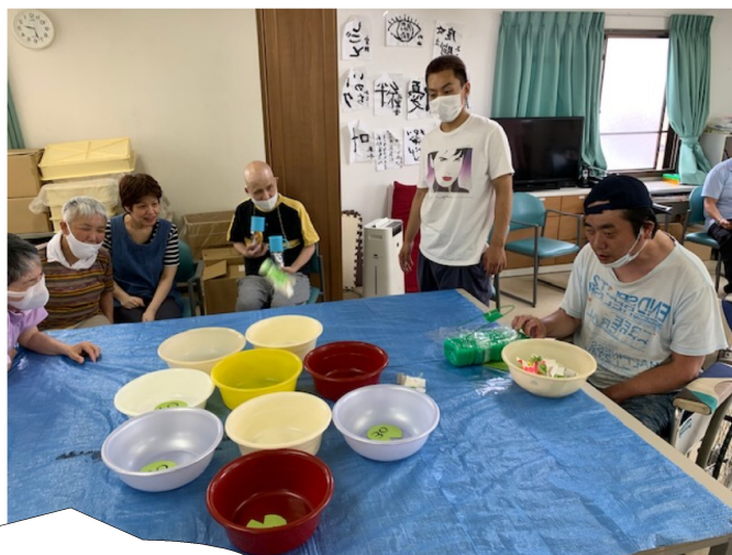
6月 梅雨 「カエル飛ばし」