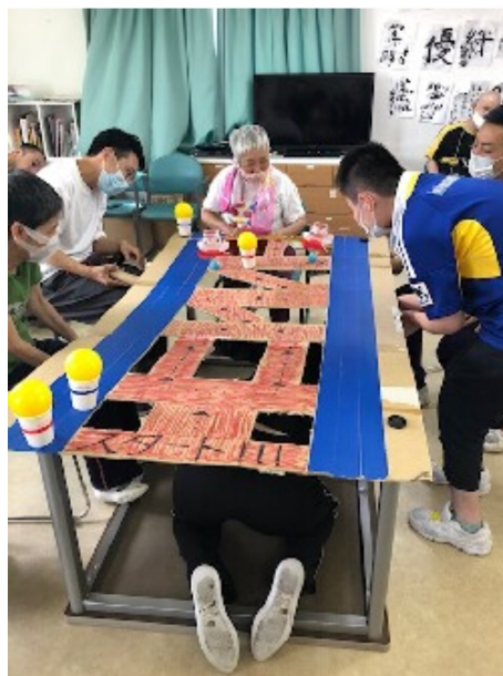
慎重に！運び屋「磁石」