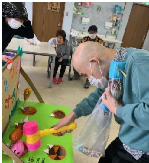
3月 啓蟄 「モグラたたき」

第二作業所では、主に月曜日の午後から、余暇的活動としてレクリエーションを行っています。季節に関連したものから、皆で競い合うもの、製作や調理等幅広く取り組んでいます。今回は、「コロナ禍における「外出自粛」での憂鬱さを吹き飛ばす、動的な活動の様子を紹介します。