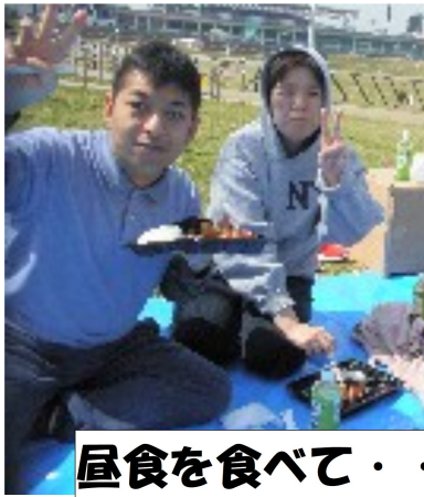
昼食を食べて・・・