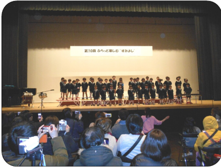
藤保育園のオープニングアクト♪