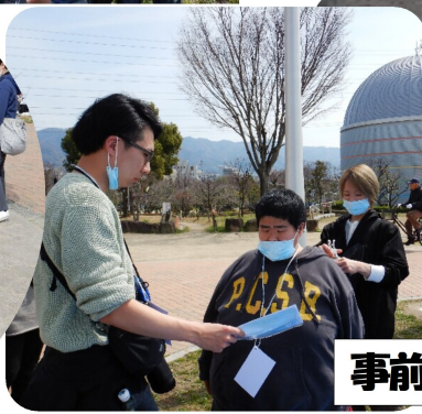
事前の確認をしっかりと!