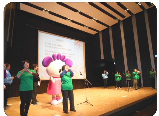
エンディングは「花は咲く」を皆で熱唱♪

去る3月16日(土)に住吉区役所にて、第10回ふらつと楽しむ「すみよし」が開催されました。 地域のみなさま、ボランティア、福祉施設が集まり、子どもから高齢者まで3世代に渡り楽しめる催しとなりました。 ホールでは、ステージ発表や商品販売、屋外では、飲食ブースや車いす体験等があり、どの企画も大賑わいでした。 よさみ野も授産製品の販売を行い、たくさんの方にご購入いただきました。本当にありがとうございました。