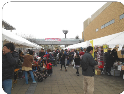
飲食ブース也大賑い！