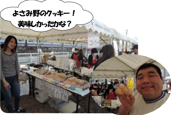
よさみ野のクッキー！ 美味しかったかな？