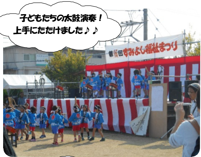
子どもたちの太鼓演奏！ 上手にたたけました♪♪